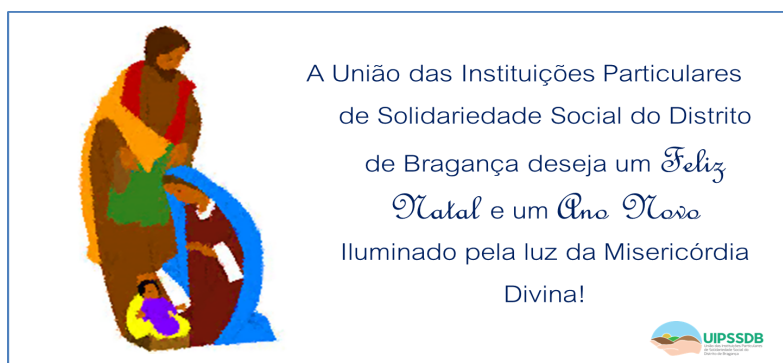
a) Postal de Natal

Foi endereçada uma mensagem, através do envio de um POSTAL de BOA PÁSCOA E FELIZ NATAL a todas Associadas.